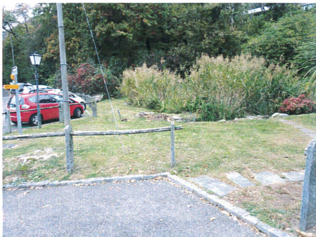
Zona camera esistente