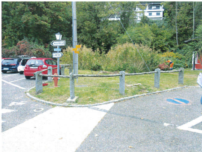
Vista da strada zona camera esistente

Mappali no. 1711 – 1596 – 1489 – 1338 RFD Ronco sopra Ascona