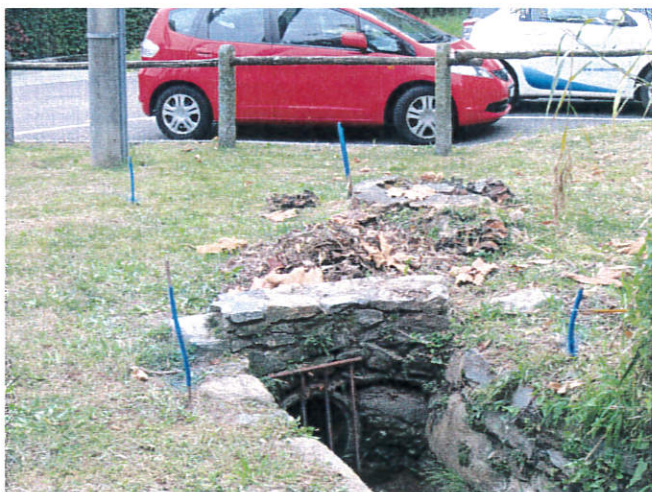
Nuova posizione camera