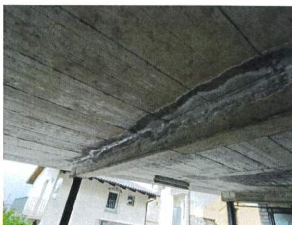
Fotografie 1+2: A sinistra la soletta di copertura con infiltrazioni di acqua e la presenza di efflorescenze. A destra alcune infiltrazioni in corrispondenza del giunto soletta – architrave.