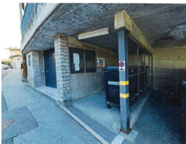
Fotografie 3+4: A sinistra la pavimentazione ammalorata e a destra il pilastro da risanare.